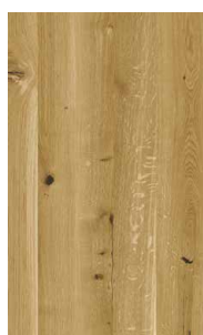
Eiche Wild Weißöl*