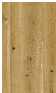
Eiche Wild Weißöl*